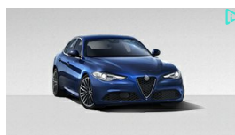
Giulia Veloce tua a 210€ al