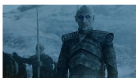
La settima stagione del