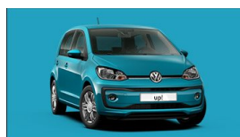
Nuova up! Da € 9.000